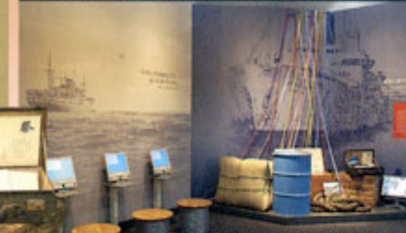
Vídeos de entrevista de testemunhas e "Nippon Maru: O último navio de emigrantes"