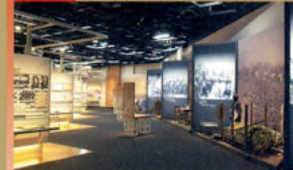
Seção da "História das Migrações ao Exterior"

A história da migração japonesa ao exterior é dividida em cinco períodos e são expostos importantes acontecimentos de cada período. Junto com isso, são expostos o mapa interativo da migração global e o mapa tridimensional que indica o número total dos emigrantes japoneses de cada província.