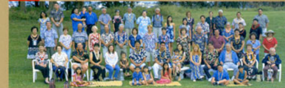
Laços de família: Família grande com a sexta geração no Haval

Várias fotografias comemorativas e vídeos mostram como os imigrantes e suas famílias passam sua vida.