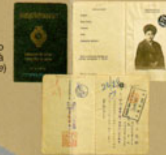
Passaportes indicando um convite para juntar-se à família no exterior (yobiyose)

Dedicado a todos os japoneses que contribuíram na construção de novas civilizações nas Américas