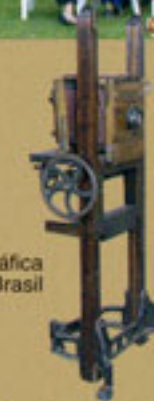
Câmara fotográfica utilizada no Brasil