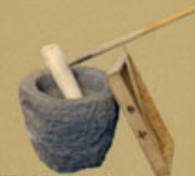
Pilão feito de rocha havaiana para amassar Mochi