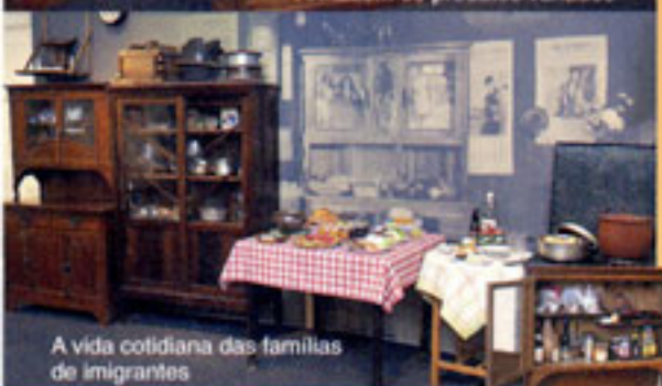
A vida cotidiana das famílias de imigrantes