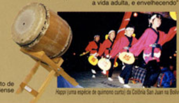
Tambor japonês ( Taiko) feito de barril de vinho canadense

A exposição mostra atividades culturais dos nikkeis dentro e fora do Japão