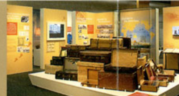
"O caminho para as Américas" Malas e miscelânea que os emigrantes levaram consigo