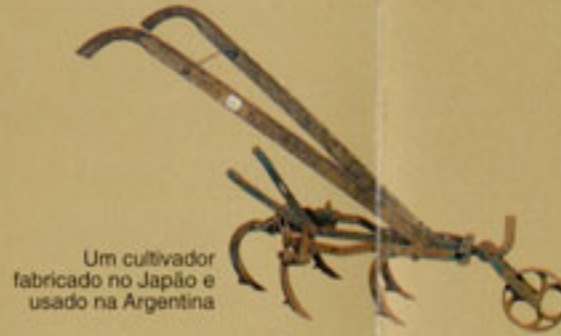
Um cultivador fabricado no Japão e usado na Argentina