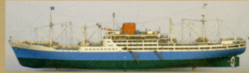
Um modelo do navio "O Brazil Maru" (segundo)