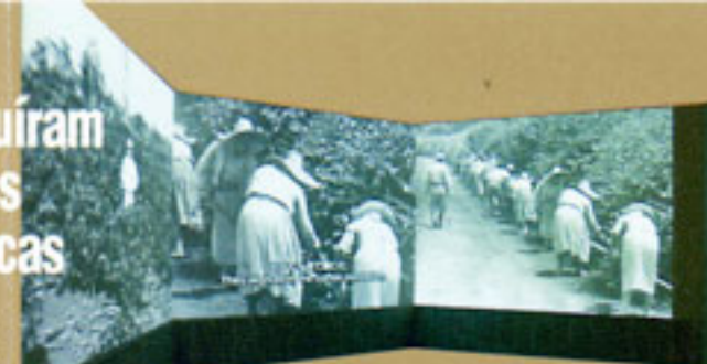
Imagens panorâmicas múltiplas "Cenário no destino"

Os pioneiros estabeleceram suas novas vidas para as gerações futuras nas Américas. Incluindo as imagens panorâmicas e uma maquete da colônia, várias cenas da vida cotidiana dos imigrantes são retratadas pelos artefatos e fotografias.