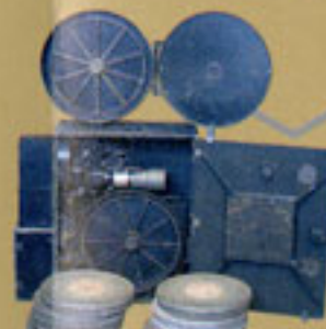
Projektor de cinema que andou pelas comunidades japonesas no Brasil