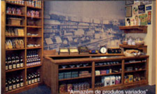
Armazém de produtos variados