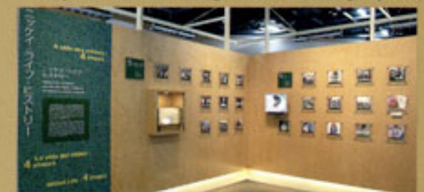
Composto pelos temas "Nascimento, crescimento, a vida adulta, e envelhecendo"