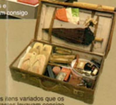
Os fens variados que os emigrantes levaram consigo