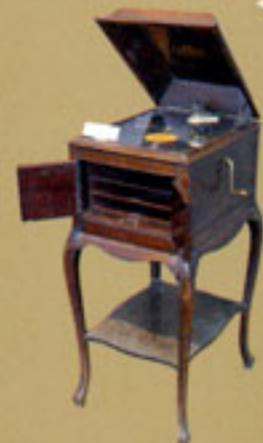
Gramofone apreciado no Peru