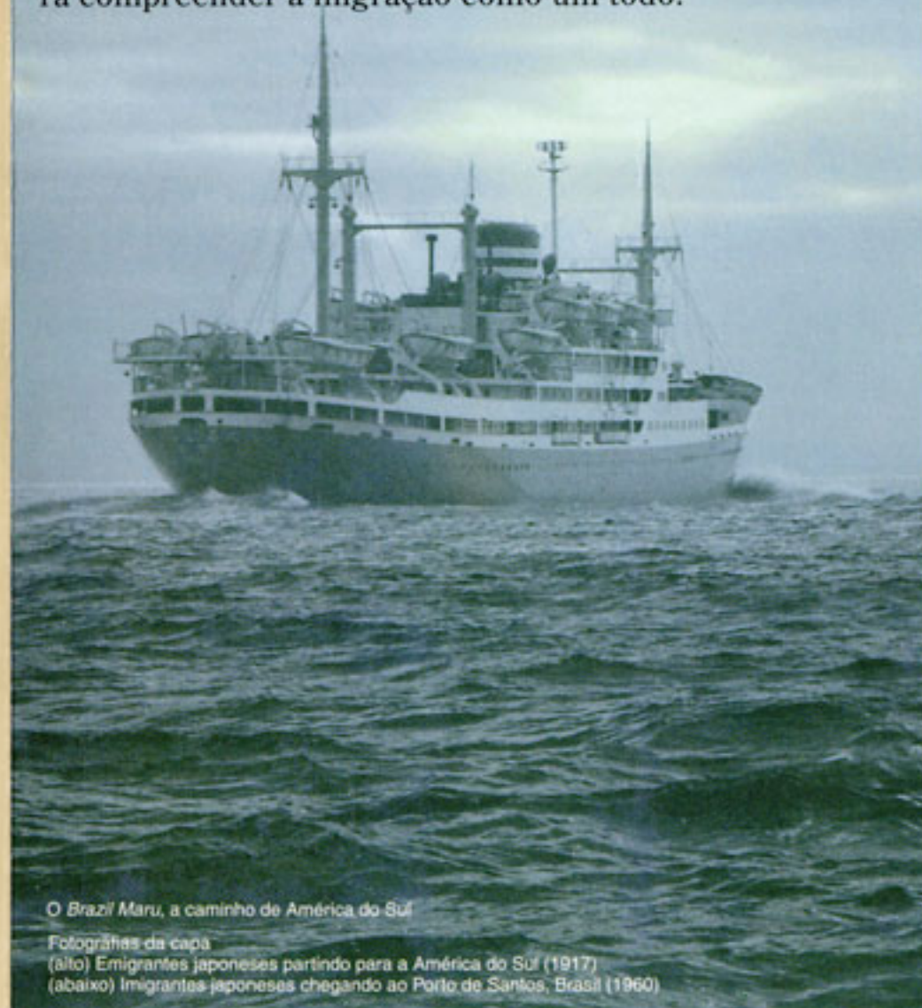
O Brazil Maru, a caminho de América do Sul Fotografias da capa (alto) Emigrantes japoneses partindo para a América do Sul (1917) (abaixo) Imigrantes japoneses chegando ao Porto de Santos, Brasil (1960)

A exposição retrata tanto a América Central e do Sul, onde a JICA teve contribuição importante nas atividades migratórias no pós-guerra, como a América do Norte, incluindo o Havai, cuja história é precursora e essencial para compreender a migração como um todo.