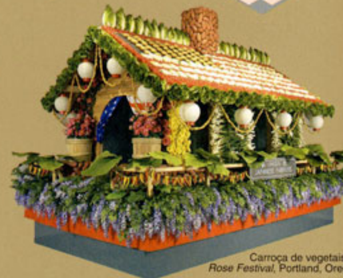
Carroça de vegetais no Rose Festival, Portland, Oregon